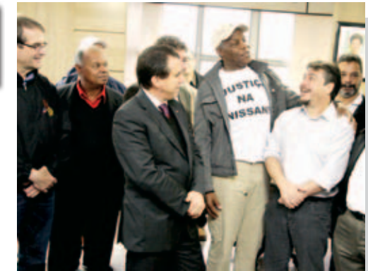
Paulo de Souza

1 O ator e ativista norte-americano Danny Glover vem ao Sindicato, junto aos companheiros na Nissan, dos EUA, e defende ação global dos trabalhadores para garantir direitos em todo o mundo.