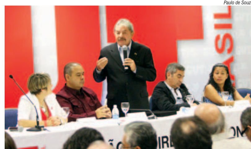
Paulo de Souza

O ex-presidente Lula participa da abertura das comemorações dos 30 anos da CUT, onde defende a organização dos meios de comunicação dos trabalhadores.